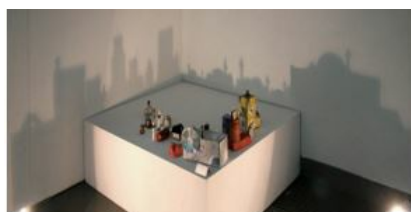
Artista Rashad Alakbarov