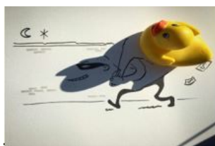
Artista Vincent Ball